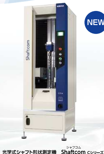
光学式シャフト形状測定機 Shaftcom Cシリーズ