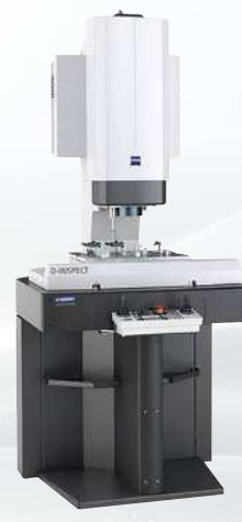
ZEISS O-INSPECT 322